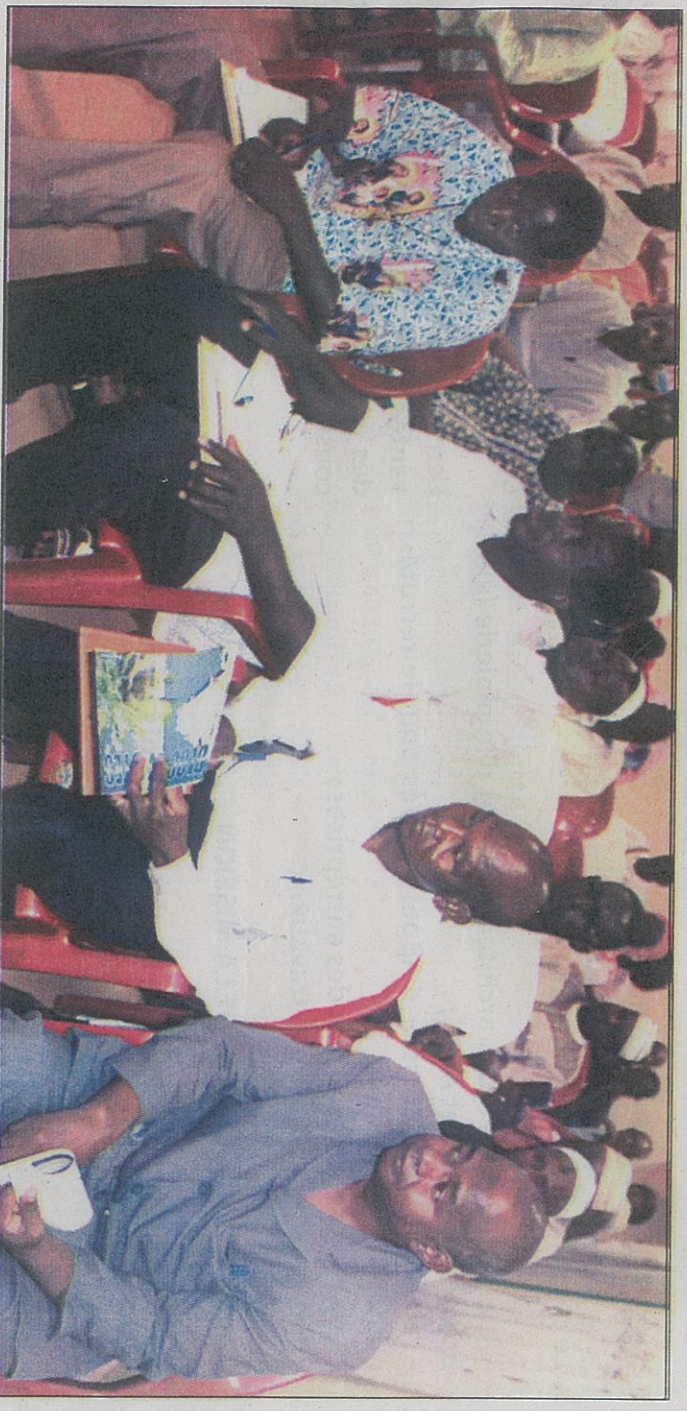
Les différentes confessions religieuses ont marqué leur présence à cet atelier

communautés hétéroclites ou source de divergence. Si les religieux peuvent être, ailleurs, des acteurs d'affrontements interconfessionnels, au Burkina, ils sont des ressorts efficaces de la paix et des acteurs de la médiation et de la conciliation sociopolitique unanime appréciés par toutes couches sociales. C'est pourquoi le RCP veut appuyer sur ces acteurs religieux et les personnes ressources actives dans la consolidation de la paix ☐